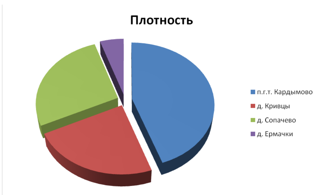
Рис. 2. – Плотность распределения по территории Кардымовского ГП

Плотность постоянного населения распределяется примерно в том же порядке, что и занимаемая площадь населенного пункта (рисунок 2).